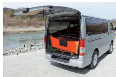
ワンボックス車にも収納可能です。