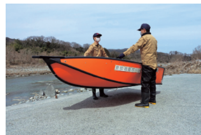
握り手により、運搬が容易です。