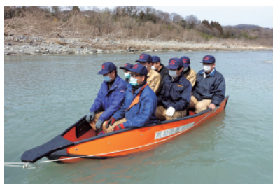
高い浮力性により、多人数の運搬が可能です。