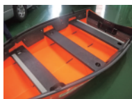
座席シート滑り止