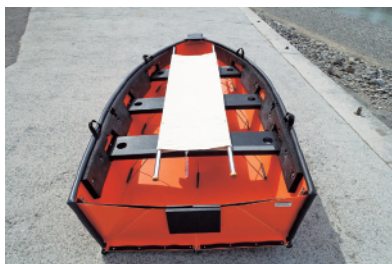
座席シートへの滑り止め加工により、安定して担架やストレッチャーを乗せたまま運搬できます。

使用時寸法／全長約3.2m×幅約1.5m 収納時寸法／全長約3.2m×厚み約20cm×幅約60cm 質量(完成時)／約52kg 座席シート数／3本 積載重量(船検)／270kg 定員(船検)／3名 最大搭載馬力／5馬力 ※予備検査費用は含んでおりません。 ※文字入れ対応可(費用別途)