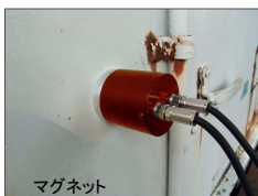
コンテナなどの金属壁面に取り付け、内部の振動・音を検知