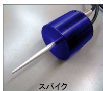
設置面が土や草などの場合、地面に突き挿して使用

Lch 3個、Rch 3個のセンサーをそれぞれ縦続接続できますので、広範囲な設置が可能です。