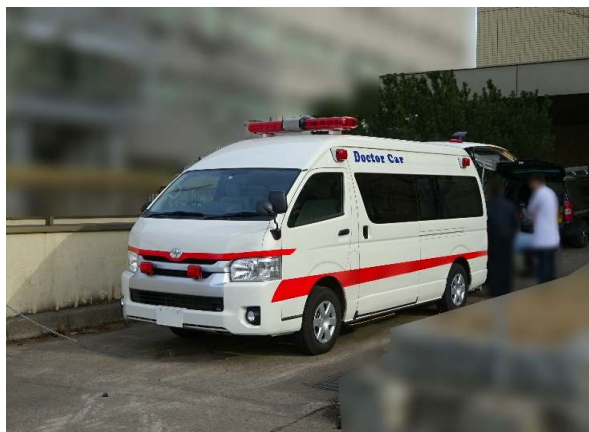
福祉車両(トヨタ・ハイース・ワイルドキャブ)からドクターカーへ改造

少ない予算で、何とかECMO搬送をしたい。 出来れば、災害時の医療支援活動にも使いたい。 そんな要望に応えた事例です。